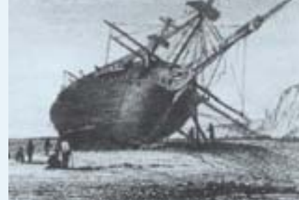
De Beagle aan de grond gezet in de Rio Santa Cruz aan de westkust van Patagonië.

te doen.- We waren op 23 dagen van Kaap Hoorn en konden op geen enkele manier Westwaarts geraken.- De laatste & beslissende storm voordat we onze pogingen staakten, was ongewoon hevig. De zee sloeg een gat in een van de sloepen en er stond zoveel water op het dek dat alles onder water kwam te staan; bijna alle papier voor het drogen van planten is onbruikbaar geworden & de helft van het verzamelde materiaal van deze tocht.- Tenslotte liepen we een beschutte inham binnen en zijn in de sloepen via kanalen in het binnenland naar het Westen gegaan.’